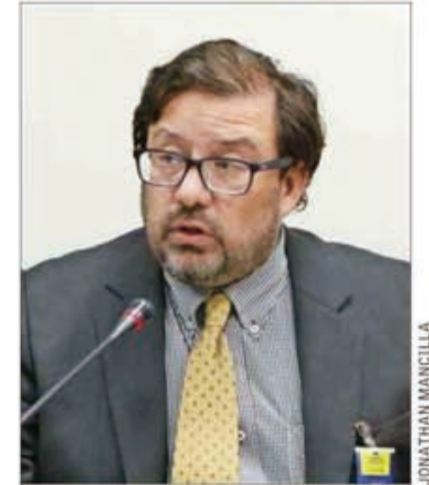
El presidente del CFA, Jorge Rodríguez.

nes a partir de gatillos automáticos. Preciso que esos gatillos podrían operar en función de alcanzar umbrales de ingresos estructurales como porcentaje del PIB, cumplimiento de metas de balance estructural superavitario y crecimiento económico.