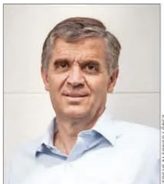
Rodrigo Vergara, investigador y expresidente del Banco Central.

precio del cobre, acotó. En su opinión, la llegada de Javier Etcheberry al Servicio de Impuestos Internos (SII) tiene que ver con tratar de destrabar todo esto, luego que la administración